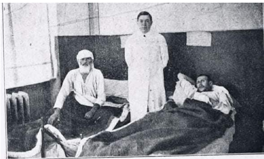
Из београдских болница: Млади Арнаутин који је убио осамдесет Срба, стара жена и деце (види слику на другој страни)